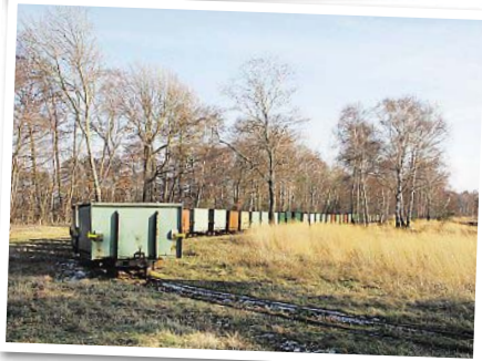
Der Torfabbau hinterlässt tiefe Spuren. Die Firma Torf- und Humuswerk Uchte beabsichtigt, die Torfgewinnung auszuweiten. Mit langen Zügen kleiner Loren wird der Torf im Moor transportiert.